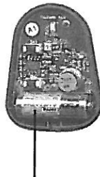
12V Alkaliskt batteri (typ 23A / MN21 el. likn.)